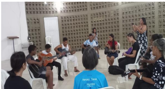
教育プロジェクトのギター教室