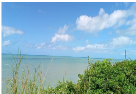
南米の最東岬から大西洋を眺める