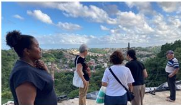
家庭訪問する途中で