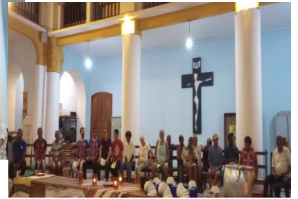
エキュメニカルで開かれたミサ