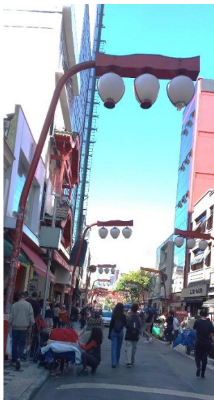
リベルダージ東洋人街