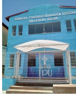
2021年11月に献堂した新会堂