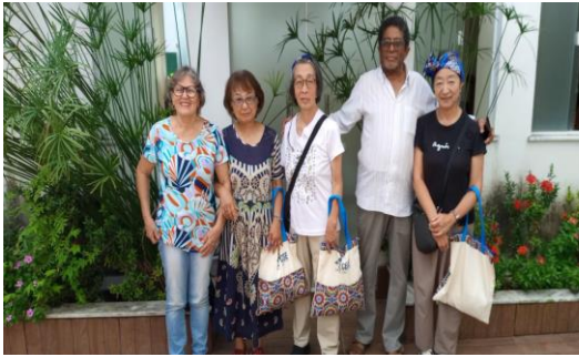
ヴァレリオ・シルヴァ合同長老教会を訪問