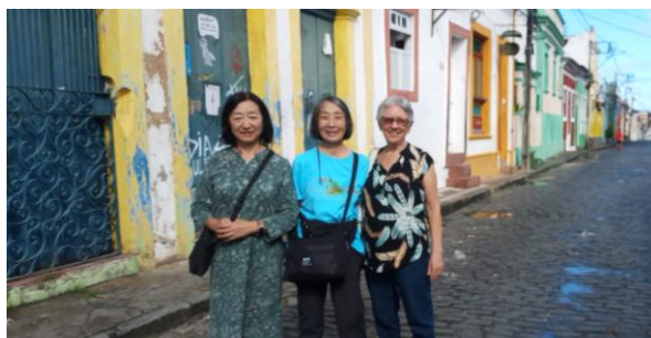
オリンダの歴史街、ジャニさんと