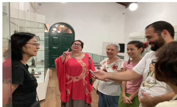
ドン・エルデル・カマラ史料館で説明を聞く