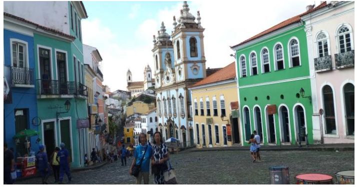
ペロウリンニョ広場でホザリオ・ドス・プレートス教会を背に