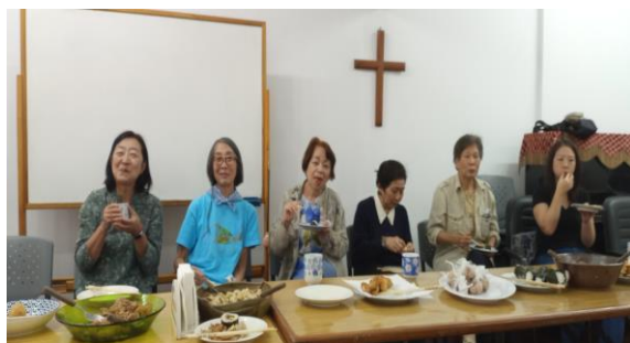
サンパウロ福音教会の昼食会