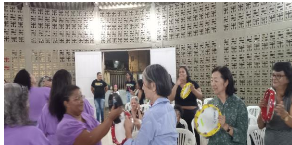
アル.ダ.ボンダージ.メソジスト教会の祈禱会で