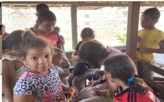
朝食会で折り紙を手にして喜ぶ子供たち