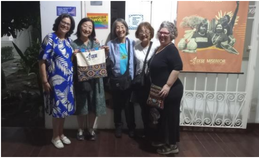
CESE (エキュメニカル社会事業支援所)の前で