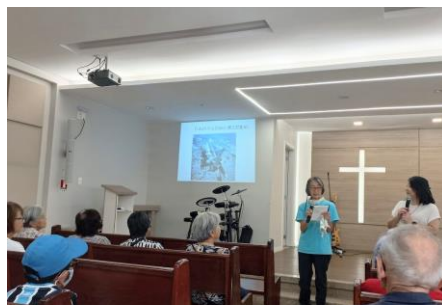
ブラジリア、アライアンス教会で