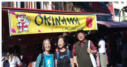
リベルダージ駅前で、沖縄移民の出店か