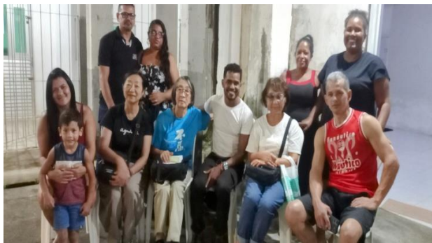
プロジェクトに参加している子供の家族と懇談