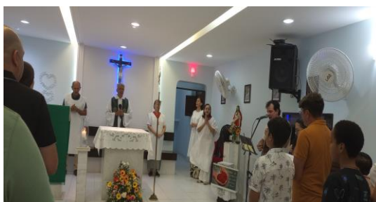
マンダカル教会のミサ