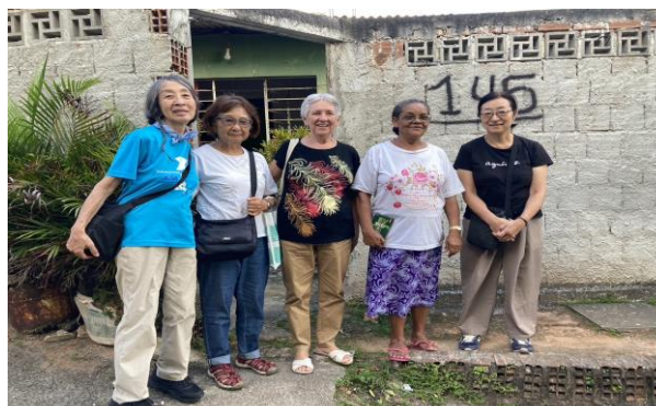
初孫が生まれて喜ぶルルーを訪問