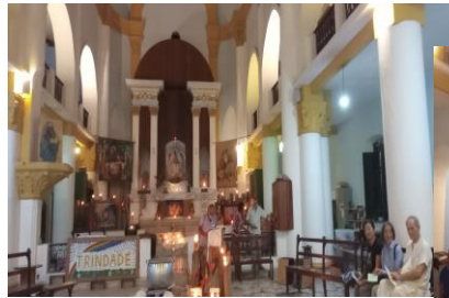
トリンダージ共同体