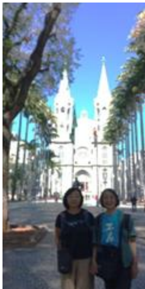
セー広場、大聖堂の前で